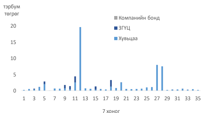
Арилжааны үнийн дүн /7 хоногоор, 2019 он/